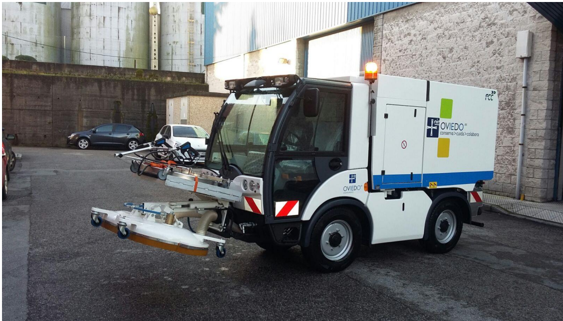
FREGADORA DECAPADORA DE ALTA PRESIÓN CON AGUA CALIENTE Y CON SISTEMA DE ASPIRACIÓN CMAR NC 280 R