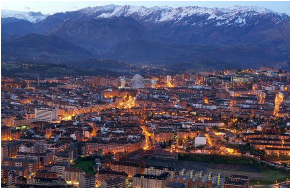
Vista de la ciudad desde el Naranco.

El municipio de Oviedo es el segundo más poblado de la comunidad autónoma, con 220.020 (INE 2018) habitantes.