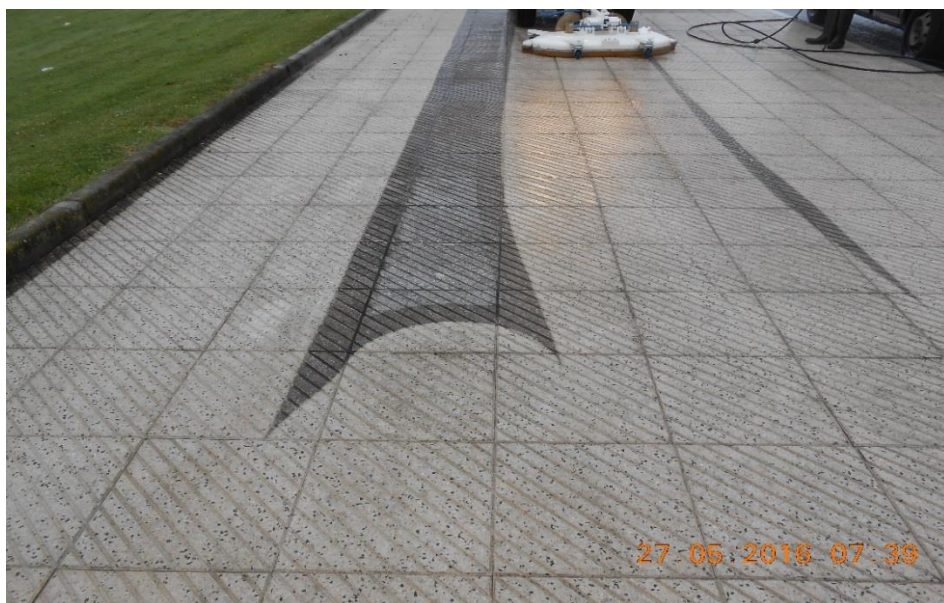
FREGADO CON DECAPADORA DE AGUA CON SISTEMA DE ASPIRACIÓN CMAR

En el año 2016 se incorporaron al servicio 3 de estas máquinas, consiguiendo el fregado de todas las aceras de la ciudad con una frecuencia de 18 meses aproximadamente. Este año se han incorporado 2 nuevas máquinas, con las que esperamos mejorar considerablemente la frecuencia.