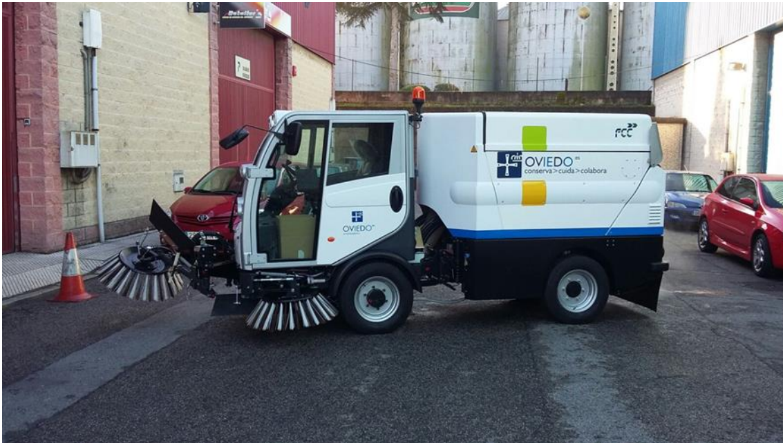
BARREDORA AUTOPROPULSADA DE ASPIRACION DE 2 M 3 DE CAPACIDAD, INSONORIZADA CON DESCARGA EN ALTURA Y TERCER BRAZO DE BARRIDO EURO6