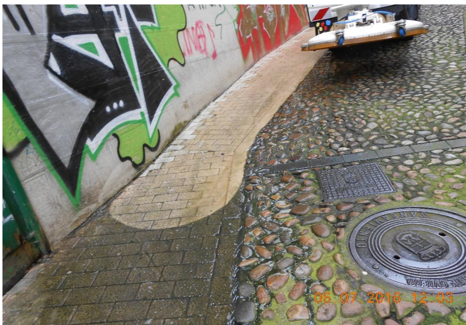
FREGADO CON DECAPADORA DE AGUA CON SISTEMA DE ASPIRACIÓN CMAR