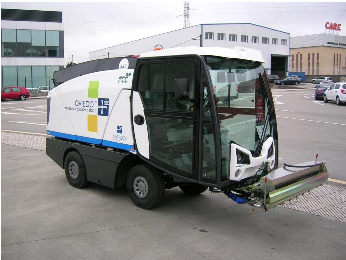
BALDEADORA AUTOPROPULSADA DE ALTA PRESION DE 1,8 M 3 DE CAPACIDAD. CON BARRA TELESCOPICA FRONTAL EXTENSIBLE