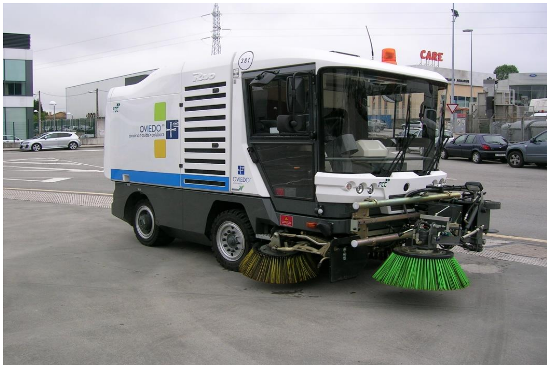
BARREDORA AUTOPROPULSADA DE ASPIRACION DE 5 M 3 DE CAPACIDAD, INSONORIZADA CON DESCARGA EN ALTURA Y TERCER BRAZO DE BARRIDO